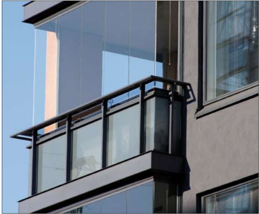
As. Oy Merenikkuna, Helsinki

Valmistajalta saa lisäapua suunniteluun, esim. AutoCAD- ja 3D-piirroksina.