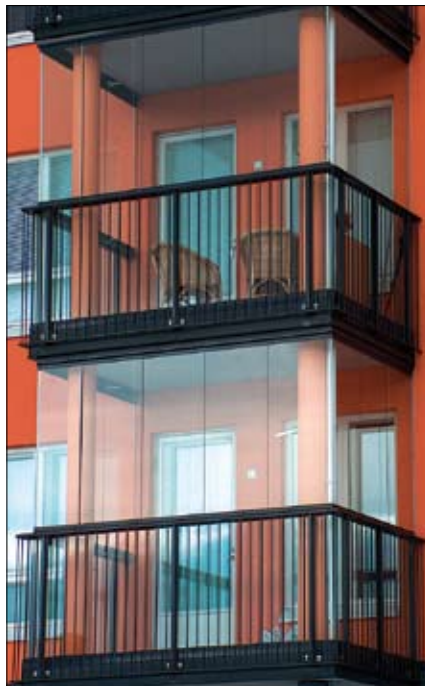
As. Oy Keisari, Vantaa