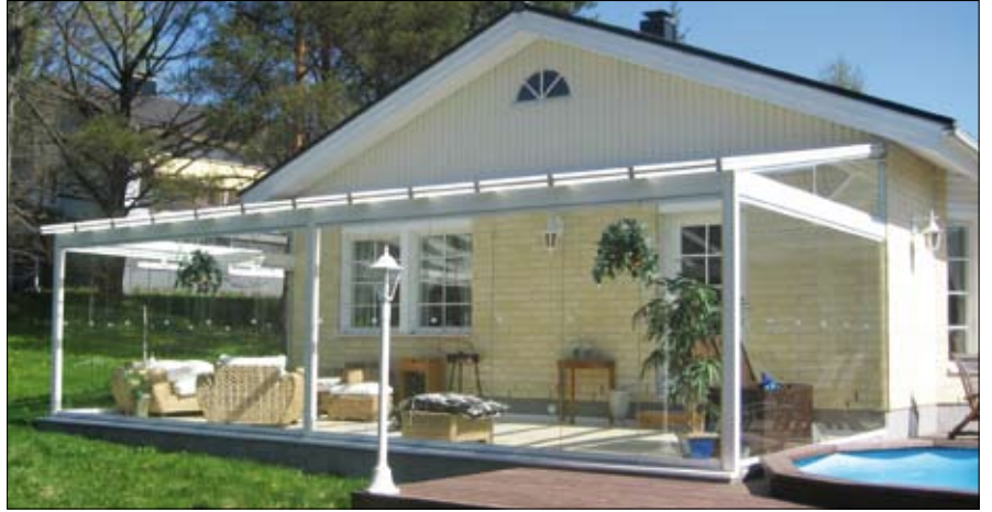
NIKA-Terassilasitus, omakotitalo, Kirkkonummi