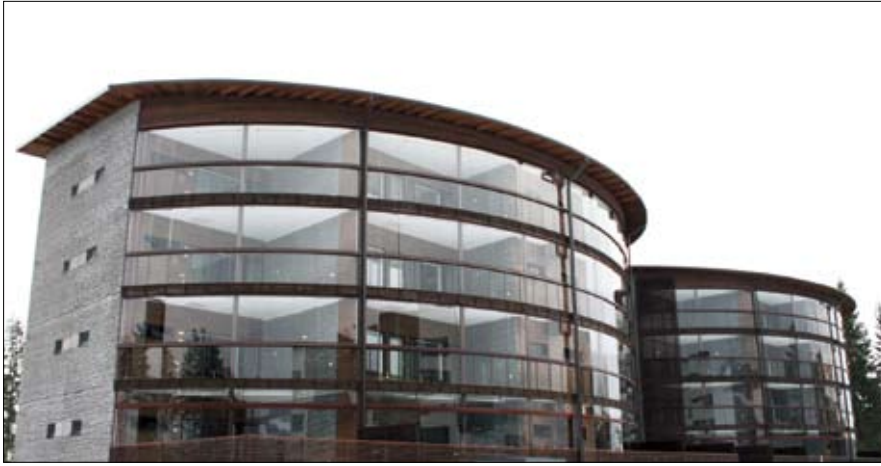
KOY Tahko Spa Suites, Nilsia