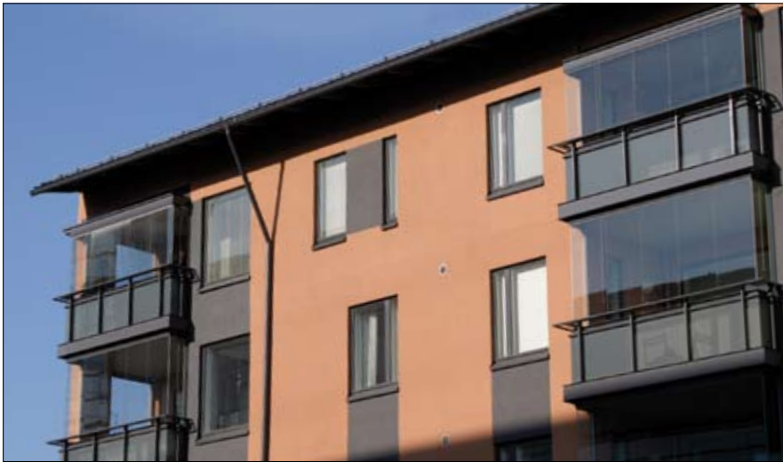
As. Oy Merenikkuna, Helsinki