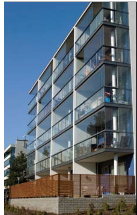
KOY Merikorttikuja 4, Helsinki