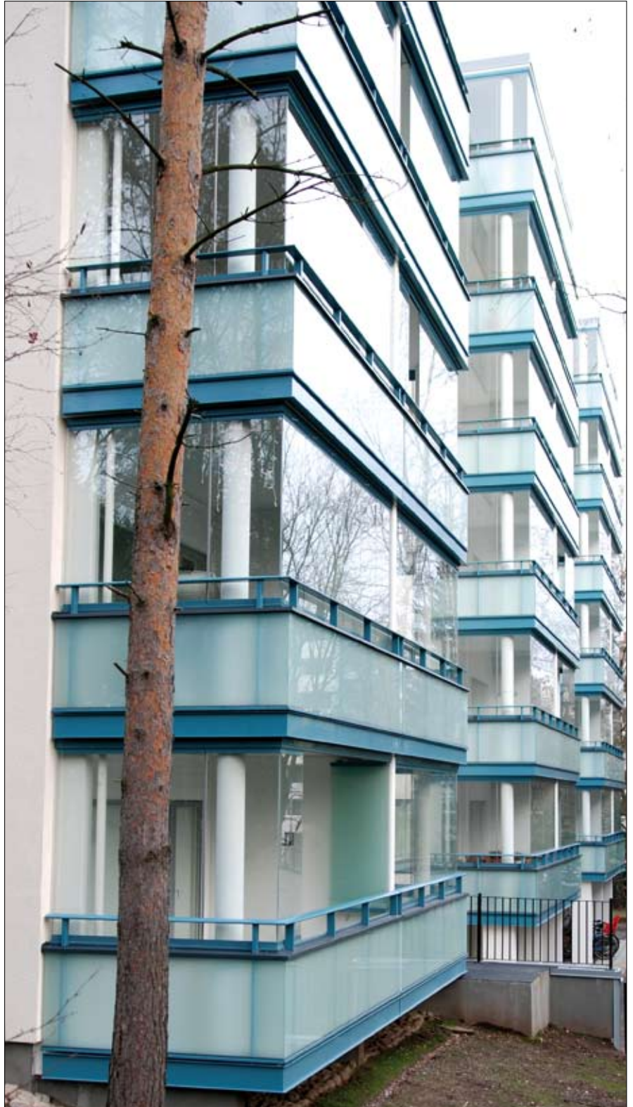
As. Oy Itälahdenkatu 4, Helsinki

NIKA-Parveke- ja -Terassilasit toimitetaan valmiiksi asennettuina. Valtuutetut asentajat asentavat lasit parvekkeen sisäpuolelta, ja asennus kestää normaalityypisessä tapauksessa noin 1 päivän. Lasituksia voidaan asentaa ympäri vuoden.